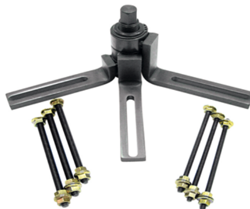
Imagen de referencia sujeta a cambio de diseño