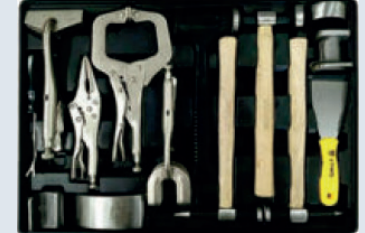
Juego de herramientas para lámina (carrocería) – 14 piezas