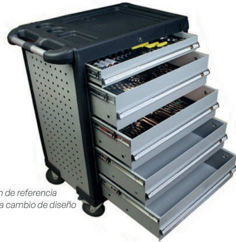
Imagen de referencia sujeta a cambio de diseño

Su diseño modular facilita la organización y optimiza los tiempos de trabajo, permitiendo a los técnicos operar de manera más eficiente y profesional.