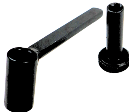
Imagen de referencia sujeta a cambio de diseño