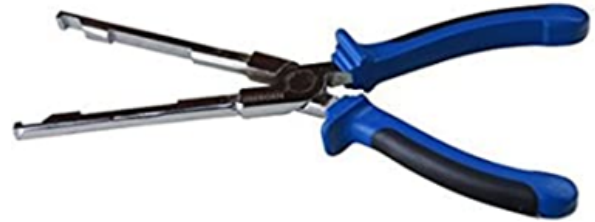
Imagen de referencia sujeta a cambio de diseño

Herramienta especializada que permite extraer los conectores eléctricos o capuchones de las bujías de incandescencia de una forma rápida y sencilla sin hacer daños a sus alrededores, con esta herramienta podemos sujetar los capuchones eléctricos que están en esas áreas de difícil acceso para retirarlos con facilidad facilitando la labor para el operario y de igual manera puedes mejorar tu productividad realizando procesos en menos tiempo y aumentar tus ingresos.