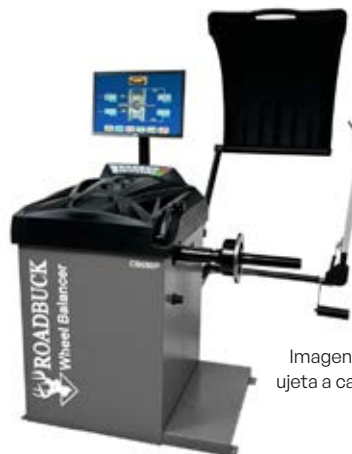
Imagen de referencia ujeta a cambio de diseño