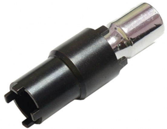
Imagen de referencia sujeta a cambio de diseño