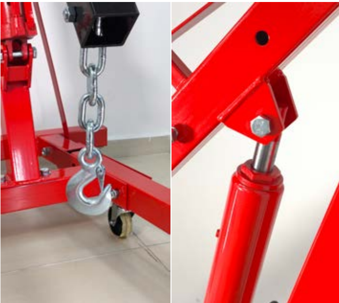
Imagen de referencia sujeta a cambio de diseño